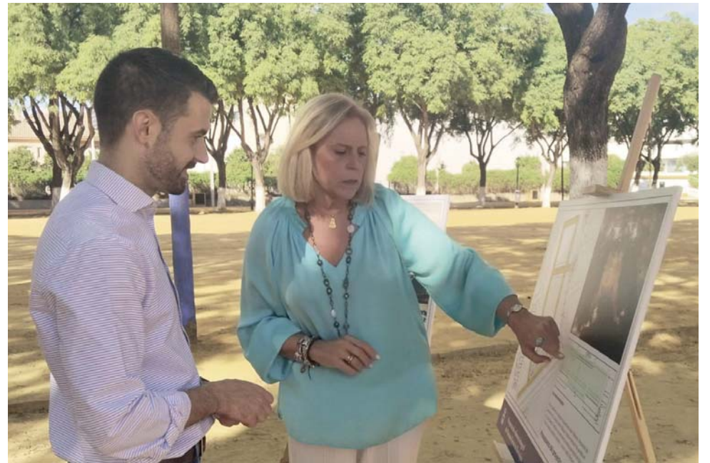
Presentación del proyecto de la reforma integral del Recinto Ferial de Bormujos. VIVA

RECINTO FERIAL Avanza la reforma con las vistas puestas en la feria