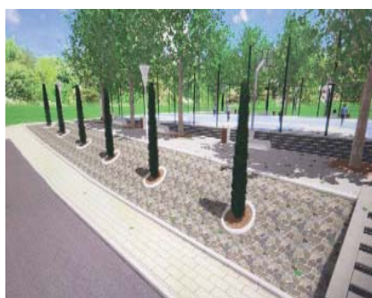
Proyecto del Nuevo Bulevar San Juan de Dios.