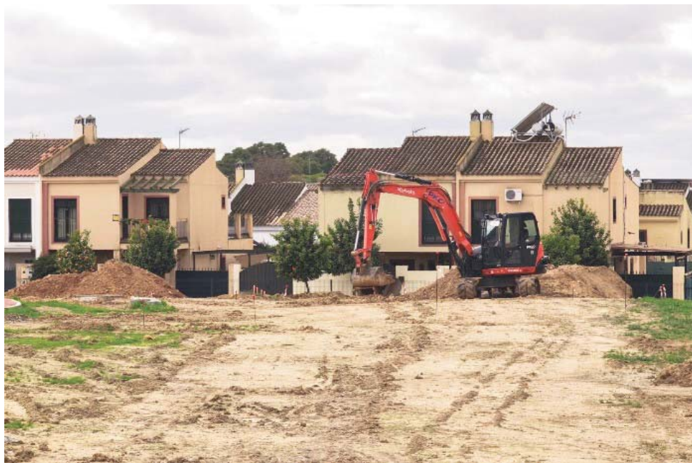
Obras del Parque Elena Huelva. AYUNTAMIENTO DE BORMUJOS

PARQUES Gracias a una inversión de 300.000 euros