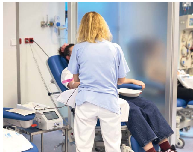
Donación de sangre.

Como indicación adicional, se recuerda que el día de la donación no se puede realizar deporte ni dos horas antes ni durante las 24 horas posteriores.