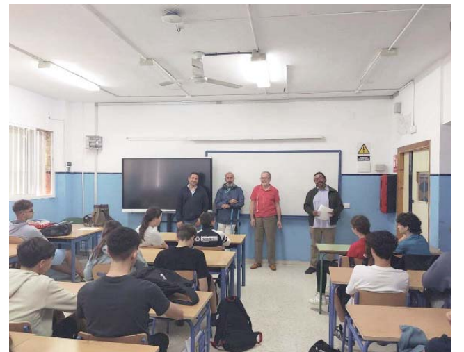
Prevención de Consumo Prematuro de Alcohol en jóvenes. AYTO BORMUJOS

Las sesiones se están llevando a cabo en ambos institutos del municipio dentro de las actividades impulsadas desde la Delegación de Juventud del Ayuntamiento para trabajar la prevención y la sensibilización entre adolescentes sobre el consumo prematuro de alcohol.