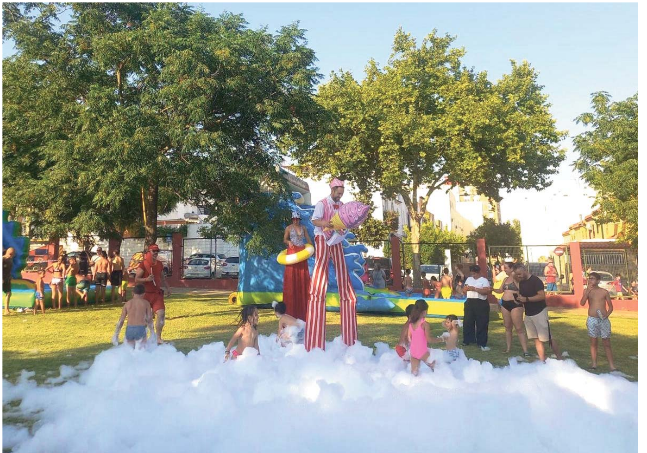
Actividades en los parques de Bormujos. VIVA

Queremos que este verano haya momentos para compartir en familia o con amigos en Bormujos”