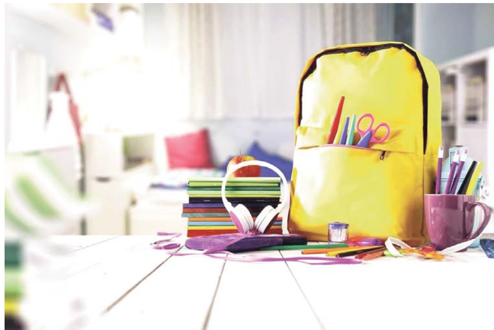
Material escolar para el colegio.

Una vez finalizado el plazo de solicitudes, se publicará un listado provisional con los expedientes admitidos, incompletos o excluidos, indicando en cada caso los motivos. Tras el periodo de alegaciones, se dará a conocer el listado definitivo. Las ayudas se entregarán mediante un vale nominativo que podrá canjearse en papelerías colaboradoras.