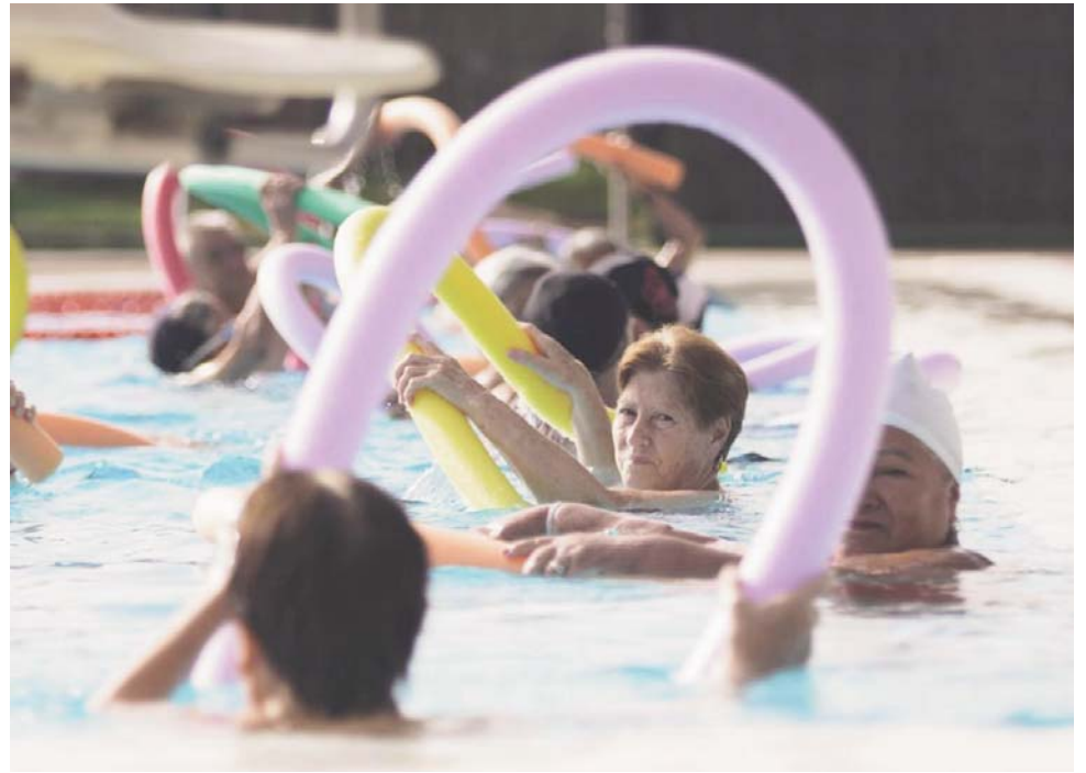
Piscina de verano de Bormujos.

Uno de los pilares de esta programación son los Talleres Deportivos de Conciliación Familiar, que comenzarán el 23 de junio, coincidiendo con el primer día no lectivo, y se prolongarán hasta el 9 de septiembre. Con horario de mañana, de 08:30 a 15:30 horas, estos talleres están pensados para ayudar a las familias durante el periodo vacacional, ofreciendo actividades deportivas, recreativas