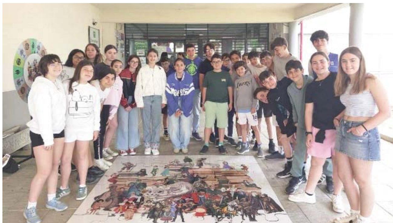
Programa de actividades de animación a la lectura. AYUNTAMIENTO DE BORMUJOS

NUEVO ENFOQUE La iniciativa busca alejar la lectura de la obligación académica y hacerla más atractiva para los alumnos de secundaria