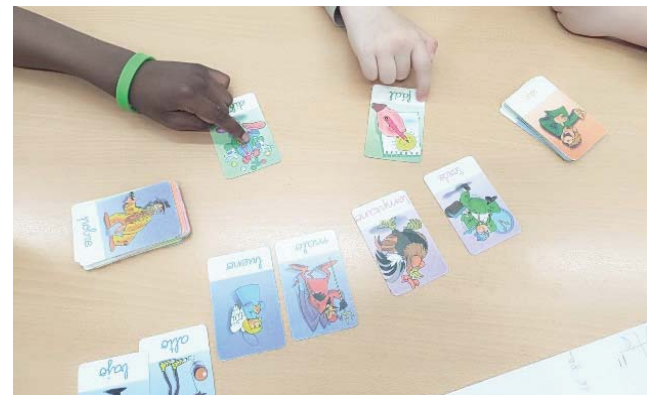
Programa de Apoyo Psicopedagógico y Logopedia en Bormujos. AYTO

El programa también cuenta con una buena acogida por parte de las familias, que valoran de forma muy positiva este acompañamiento.