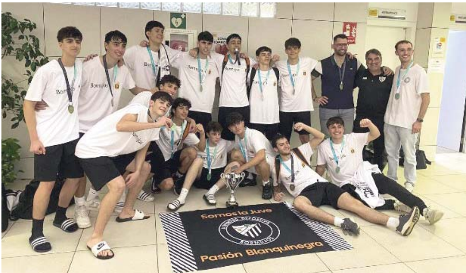
El equipo júnior de la JD Bormujos celebra el título.