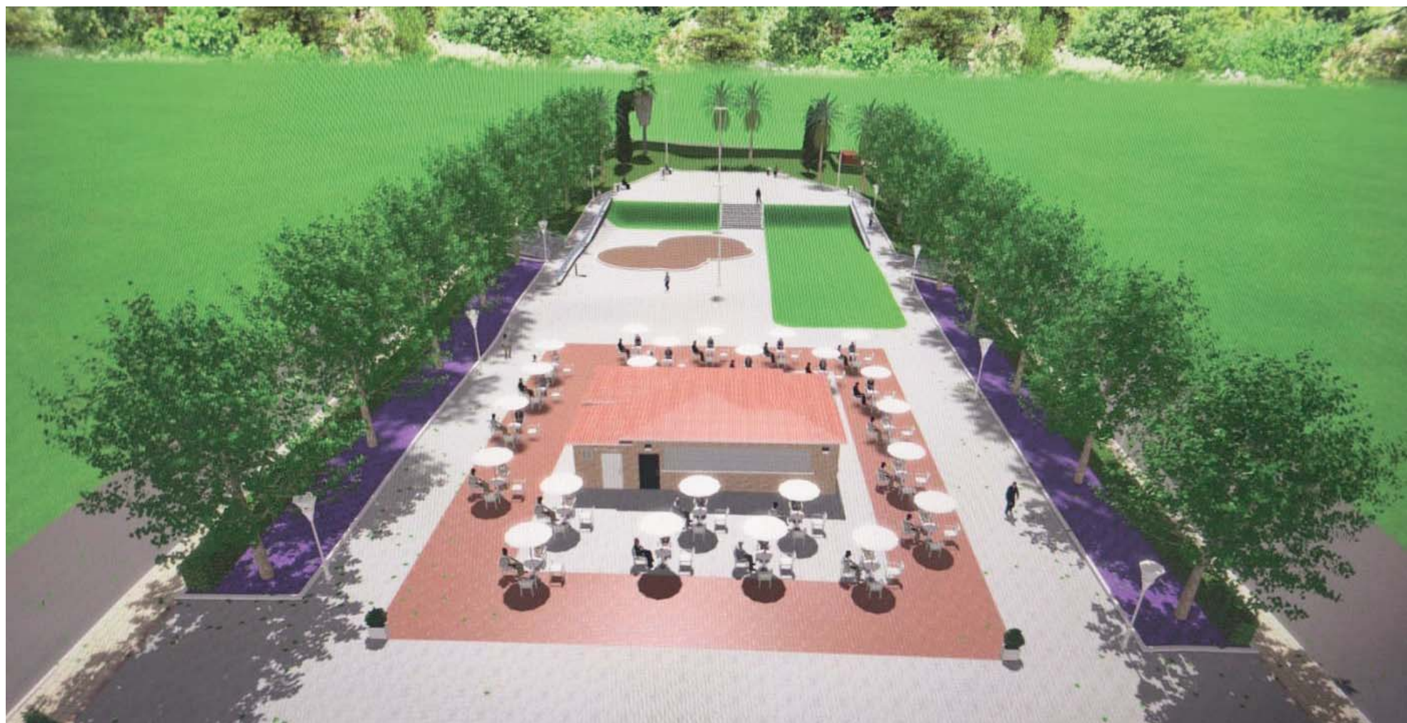
Proyecto del Nuevo Bulevar San Juan de Dios. AYTO BORMUJOS

REFORMA El Ayuntamiento proyecta una reforma integral del Bulevar de San Juan de Dios con una inversión de 2,5 millones de euros UNIFICACIÓN Se eliminará la carretera que divide el parque infantil y la zona canina será reubicada para crear un espacio más integrado DEPORTE Nuevas pistas de fútbol, baloncesto y calistenia