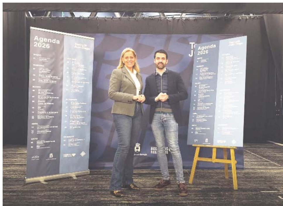
Presentación de la Agenda del Teatro Juan Diego de 2026.