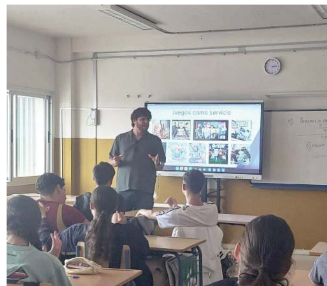
Programa ante el uso de pantallas en Bormujos.

TALLER Reflexión sobre los hábitos digitales