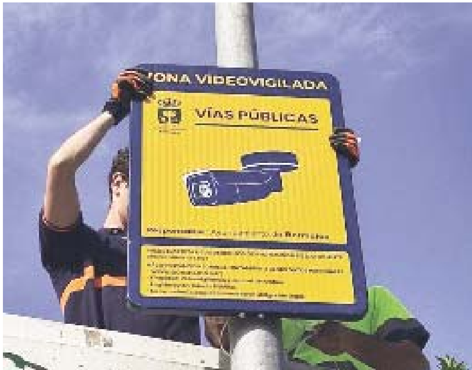
Cámaras de videovigilancia en Bormujos. AYTO BORMUJOS

PRIVACIDAD Uso limitado de las imágenes solo en caso de investigación