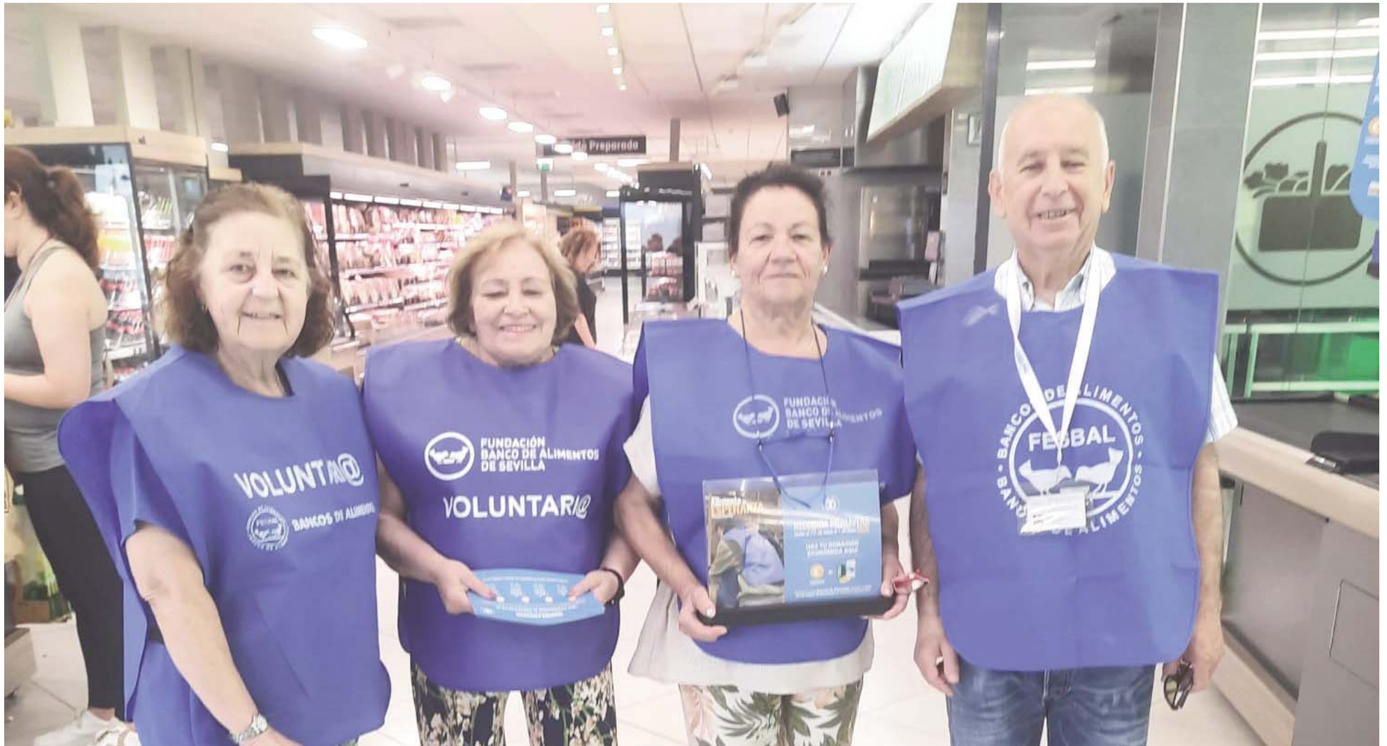
Banco de alimentos en el Aljarafe. AYTO DE BORMUJOS