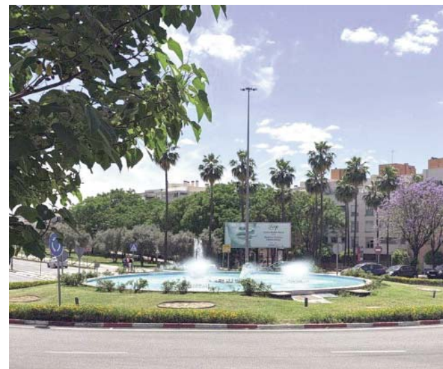
Fuente de la A-8062.

Además de la reparación técnica, el Ayuntamiento también ha tramitado un nuevo contador eléctrico para garantizar el suministro necesario y ha sacado adelante un contrato específico de mantenimiento y control de legionella. La intención es que la fuente no solo funcione, sino que además lo haga cumpliendo todas las medidas de seguridad y salubridad exigidas para este tipo de instalaciones públicas.