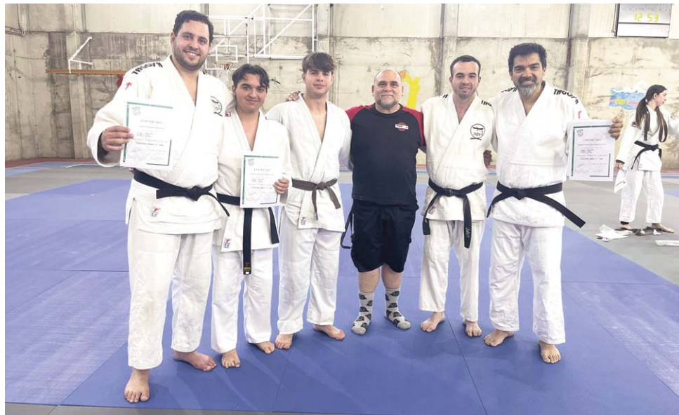
Cinturones negros de Lithojudo. LITHOJUDO

Pero el calendario de Lithojudo aún tiene varias fechas marcadas en rojo. La próxima semana el club estará presen-