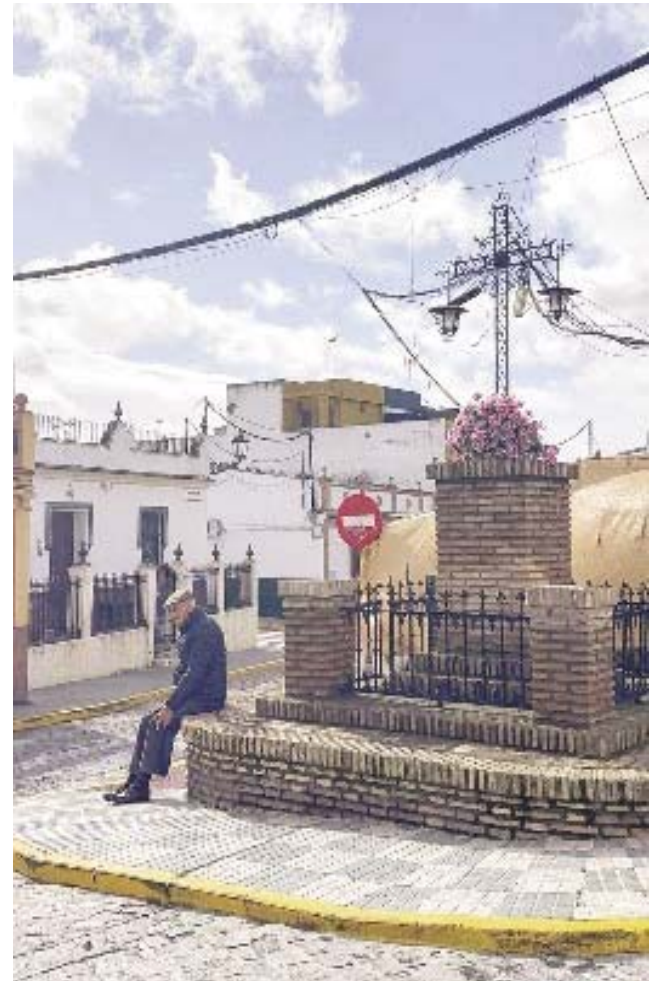
Plaza de la Cruz en Bormujos.

Desde el gobierno municipal aseguran que este proyecto forma parte de una línea de trabajo más amplia para seguir mejorando diferentes espacios del municipio.