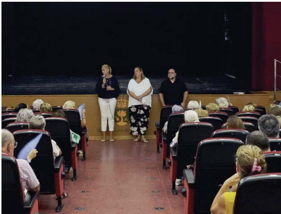
Actividad con los mayores en Bormujos. AYTO BORMUJOS